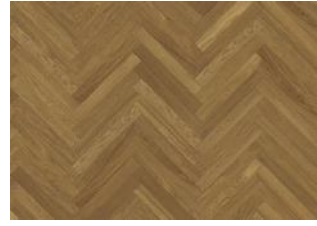
Studio Eiche AB 11 mm