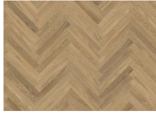
Studio Eiche AB Weiß 11 mm